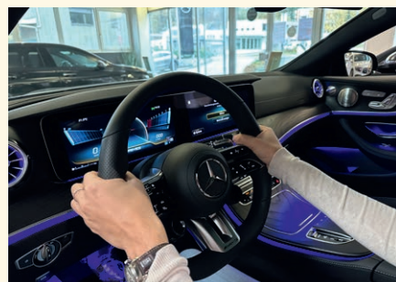
DIE KORREKTE LENKRADPOSITION: DIE HÄNDE AUF «VIERTEL VOR DREI» UND DIE DAUMEN IN DER DAFÜR VORGESEHENEN EINBUCHTUNG.