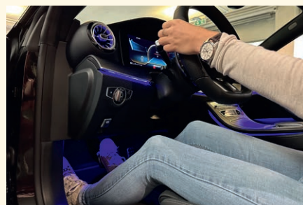
LEICHT ANGEWINKELTE BEINE: SO DASS BEI EINER VOLLBREMSUNG DIE BEINE NIE GANZ DURCHGESTRECKT SIND.