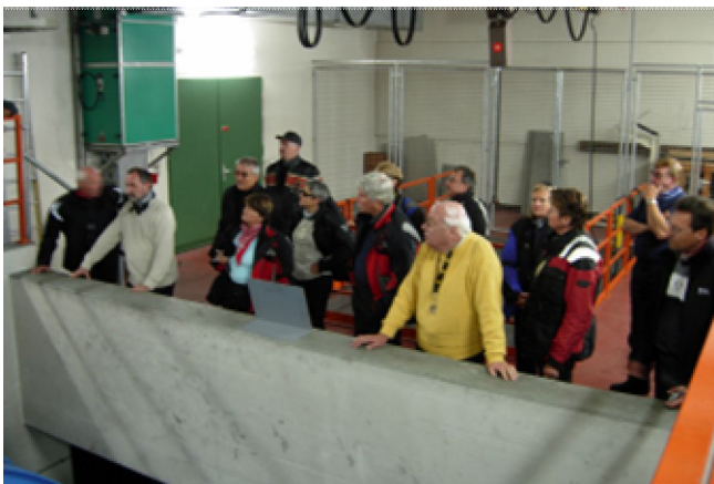
Besichtigung der Sicherheitseinrichtungen Gotthard Strassentunnel (hier bei den Ventilatoren)