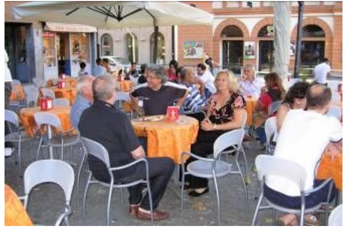
..... zum verdienten Apéro auf der Piazza