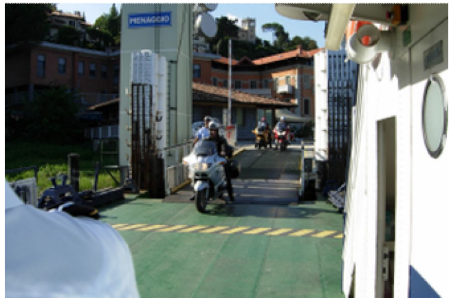
gar nicht so einfach bei hohem Wellengang!!