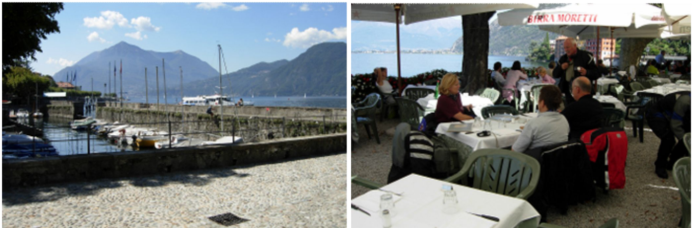
Fahrt von Lecco durchs Valsassina an den Comer-See zum Mittagshalt in Baleno