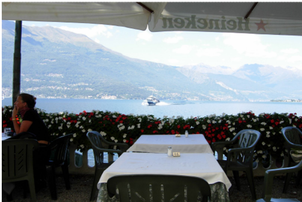
sie sind nicht nur auf dem Wasser schnell, die Italiener!! Auch auf der Strasse geht es zügig vorwärts.