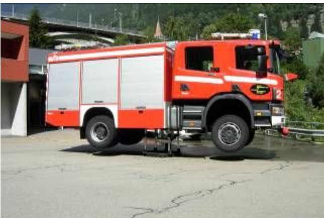
... und der wendet an Ort und kehrt wieder zurück.