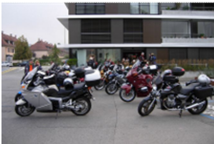
Start: in Muttenz