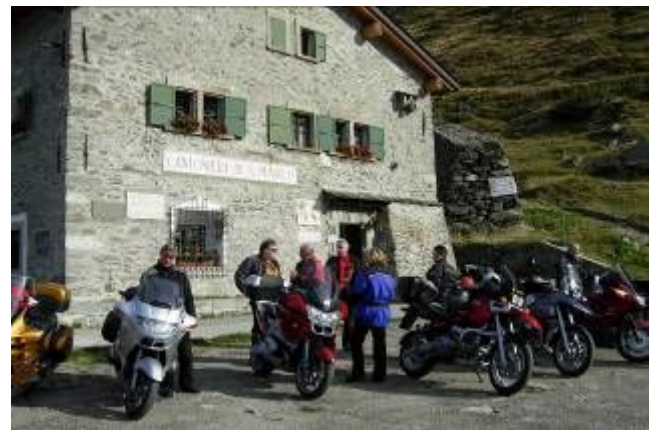
Kaffehalt in wärschaftem Schutzhaus unterhalb der Passhöhe.