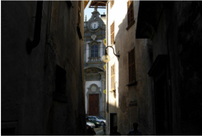
durch verschlungene Gassen in Morbegno geht es .....