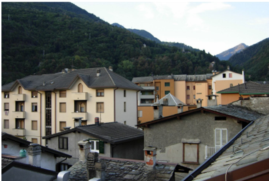
Gut angekommen in Morbegno. Abendstimmung und Blick Richtung Süden.