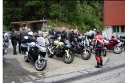
im Werkhof Göschenen angekommen