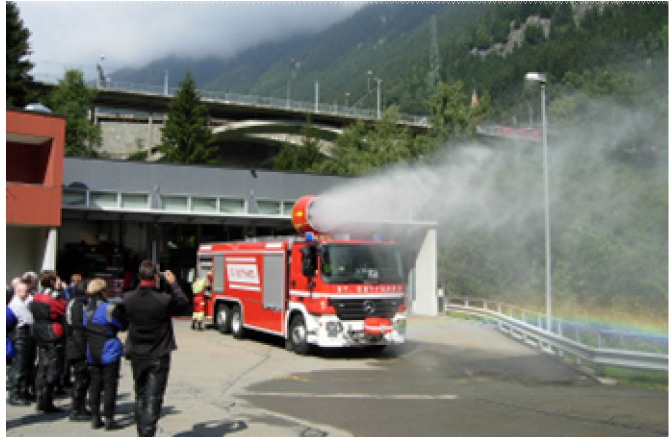
Imposante Fahrzeuge fürs Grobe im Vorwärtsgang...