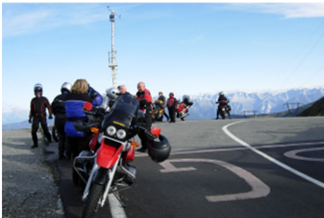
Diverse Routen standen auf dem Programm: hier der Passo San Marco mit Blick Richtung Bergell.