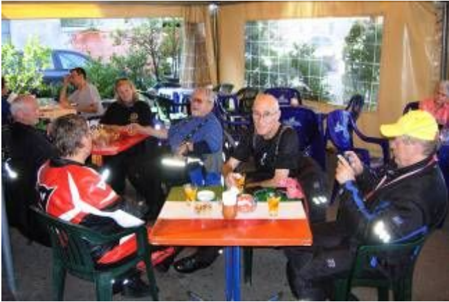
weiter gings nach Menaggio; kurzer Halt vor der Fähre