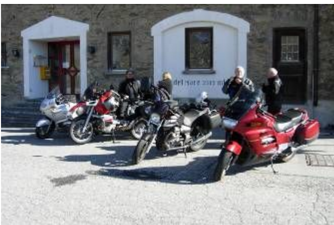
Zwischenhalt auf dem Berninapass, weiter über den Julier und dann noch der Mittaghalt auf der Lenzerheide.