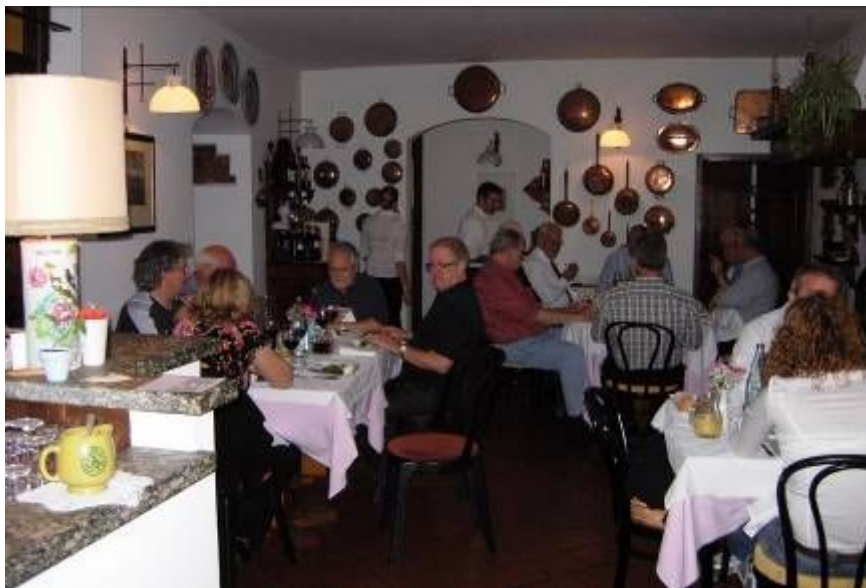
Die frische Luft regt den Appetit an: im Rest. vecchio fiume gibts Abhilfe.