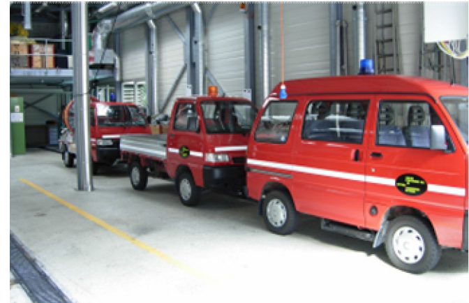
Die „Bonsais“ für den engen Fluchttunnel