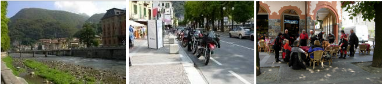
San Pellegrino: nicht nur auf den Flaschen sondern auch am Ortseingang so angegeben.